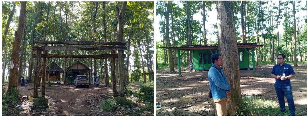
Gambar 6-7. Area Peristirahatan Rumah Kaca

Melalui kunjungan untuk pemetaan desa pada tahap awal ini, di dapat pemetaan sebagai berikut: