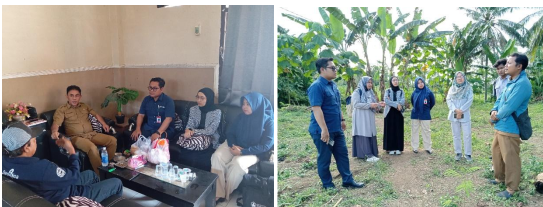
Gambar 1-2. Koordinasi dengan aparatur desa dan perwakilan POKDARWIS Desa Seputih

Berangkat dari hal tersebut, kegiatan pengabdian ini dilaksanakan melalui pendekatan partisipatif berbasis Participatory Rural Appraisal (PRA). Hasil pendekatan dengan metode PRA menghasilkan kondisi sosial desa atau peta desa yang menunjukkan potensi, masalah, peluang dan kekuatan yang dimiliki masyarakat untuk dijadikan dasar perencanaan pemecahan masalah, rencana program, capaian dan monitoring bersama sesuai potensi dan kemampuan (Muhsin, dkk., 2018). Dengan berdasar pada metode PRA tersebut, kegiatan pengabdian ini diawali dengan melakukan pemetaan desa sekaligus Transek atau penelusuran desa untuk melakukan pengamatan langsung dan mengidentifikasi potensi wisata Desa Seputih bersama dengan aparatur desa sekaligus perwakilan POKDARWIS. Dalam rangka pemetaan desa, tim pengabdian melakukan kunjungan ke Desa Seputih pada tanggal 28 April 2025. Kunjungan ini diawali dengan koordinasi bersama aparatur dan perwakilan POKDARWIS setempat di Balai Desa Seputih yang beralamat di Jalan Mumbulsari No.27, Kecamatan Mayang, Kabupaten Jember. Dalam koordinasi ini, juga dilakukan wawancara guna mendapatkan informasi tambahan terkait atraksi wisata Desa Seputih dan untuk mengidentifikasi permasalahan terkait manajemen pariwisata desa yang selama ini telah dilakukan, serta peluang dan kekuatan yang dimiliki desa dan masyarakat.