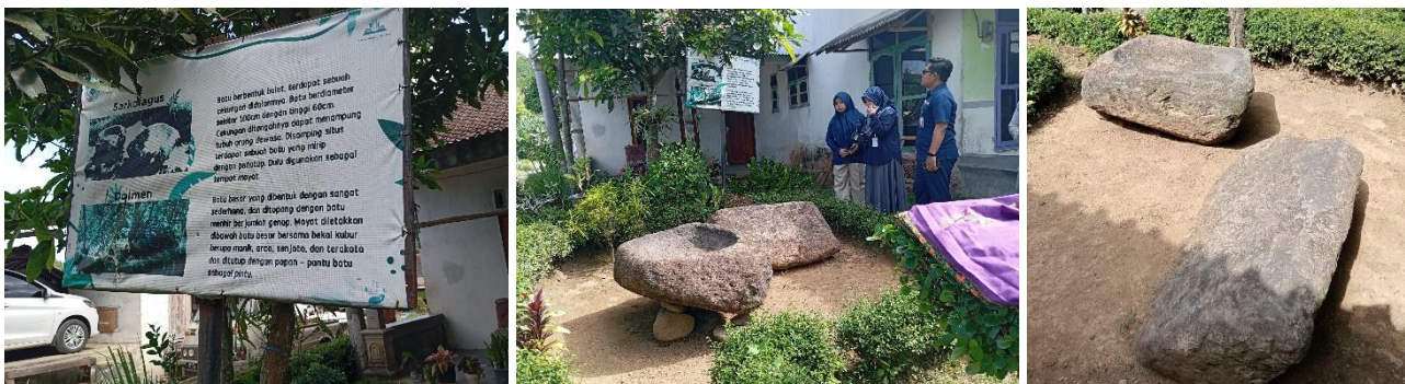
Gambar 3-5. Situs Sarkofagus di Desa Seputih

Selain mengunjungi lokasi wisata sejarah, tim juga melakukan kunjungan ke atraksi wisata lain di Desa Seputih yakni Area Peristirahatan Rumah Kaca. Area peristirahatan ini merupakan area hutan desa yang difungsikan oleh pemerintah desa sebagai rest area dan/ atau area santai bagi para wisatawan dengan membangun rumah kaca sebagai tempat istirahat utama. Di area ini juga terdapat penjual makanan dan minuman serta pedagang kaki lima yang menyediakan makanan lokal setempat. Dikarenakan luasnya area ini serta suasana dan pemandangan yang begitu asri, area ini juga dapat digunakan sebagai area bersepeda pagi bagi para wisatawan yang menginap di Desa Seputih. Selain itu, akses menuju rest area ini juga layak dan memadai, sehingga baik wisatawan pengguna roda dua maupun empat, dapat dengan mudah masuk dan menggunakan area ini semaksimal mungkin.