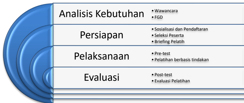
Gambar 1. Prosedur Pelatihan