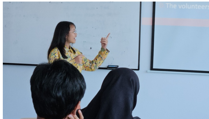
Gambar 4. Kegiatan Presentasi

Data kuantitatif pada Gambar 2 yang didukung dengan observasi langsung selama pelatihan mengindikasikan bahwa penggunaan metode proyek kolaboratif dan simulasi situasi nyata (misalnya rapat, wawancara, presentasi produk) sangat membantu peserta untuk memahami konteks penggunaan bahasa Inggris yang aplikatif dan relevan dengan bidang keahlian mereka di SMK (Gambar 4).