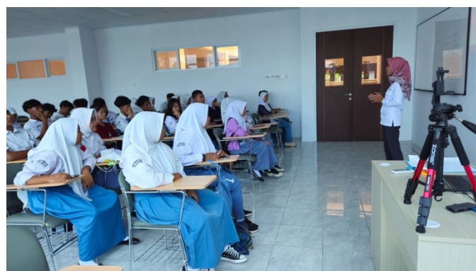
Gambar 3. Pelaksanaan Pelatihan

Hasil evaluasi pre-test dan post-test menunjukkan adanya peningkatan kompetensi bahasa Inggris peserta yang berjumlah 36 orang pada keempat aspek keterampilan (listening, reading, writing, speaking). Peningkatan ini menunjukkan adanya peluang lebih besar di level-level rendah yang berkaitan dengan spektrum dan batasan kemampuan yang terindikasi pada descriptor CEFR (Alexiou & Stathopoulou, 2021; Schneider, 2020).